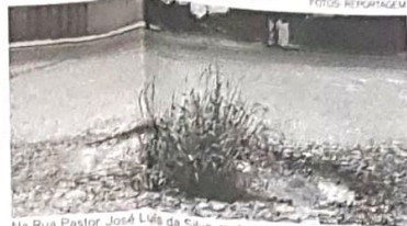
Na Rua Pastor José Luís da Silva, muitos crescem nos buracos

operação nunca foi paralisada. "Os servidores trabalham diariamente para realização deste trabalho. O grande volume de chuvas que tem caído nos últimos meses, praticamente todos os dias acaba dificultando o tra-