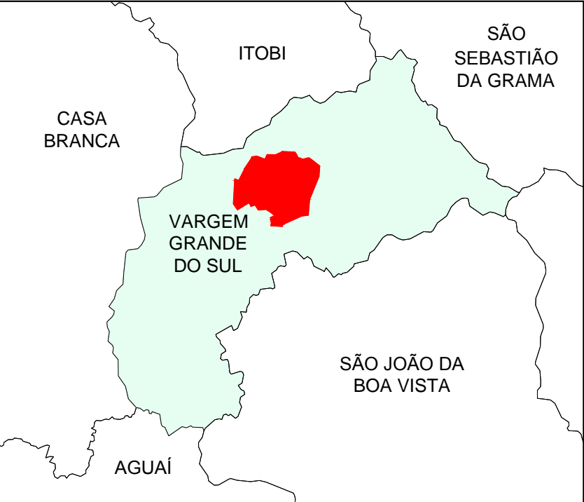
ÁREA DE ESTUDO