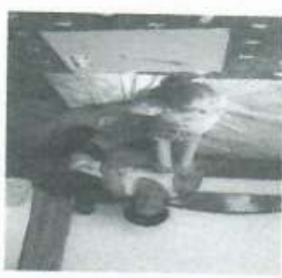
Atendimentos domiciliares no recesso escolar